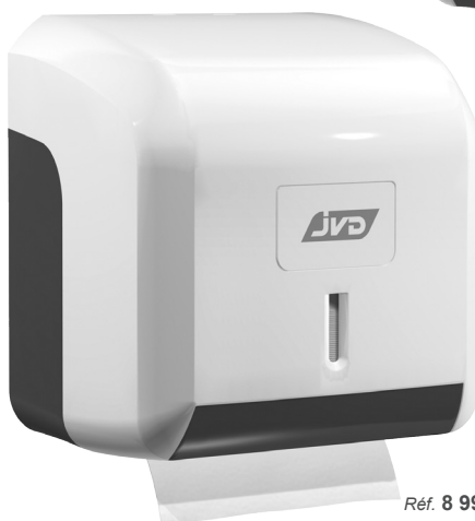
Réf. 8 99 608