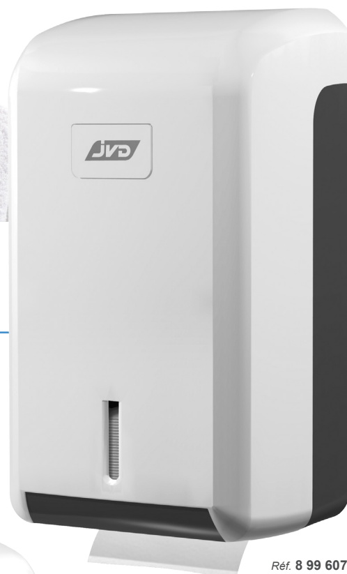
Réf. 8 99 607